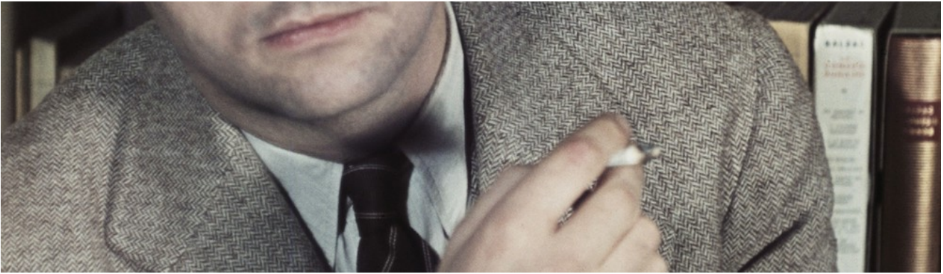
Détail de la couverture du N°82 de La Règle du jeu .