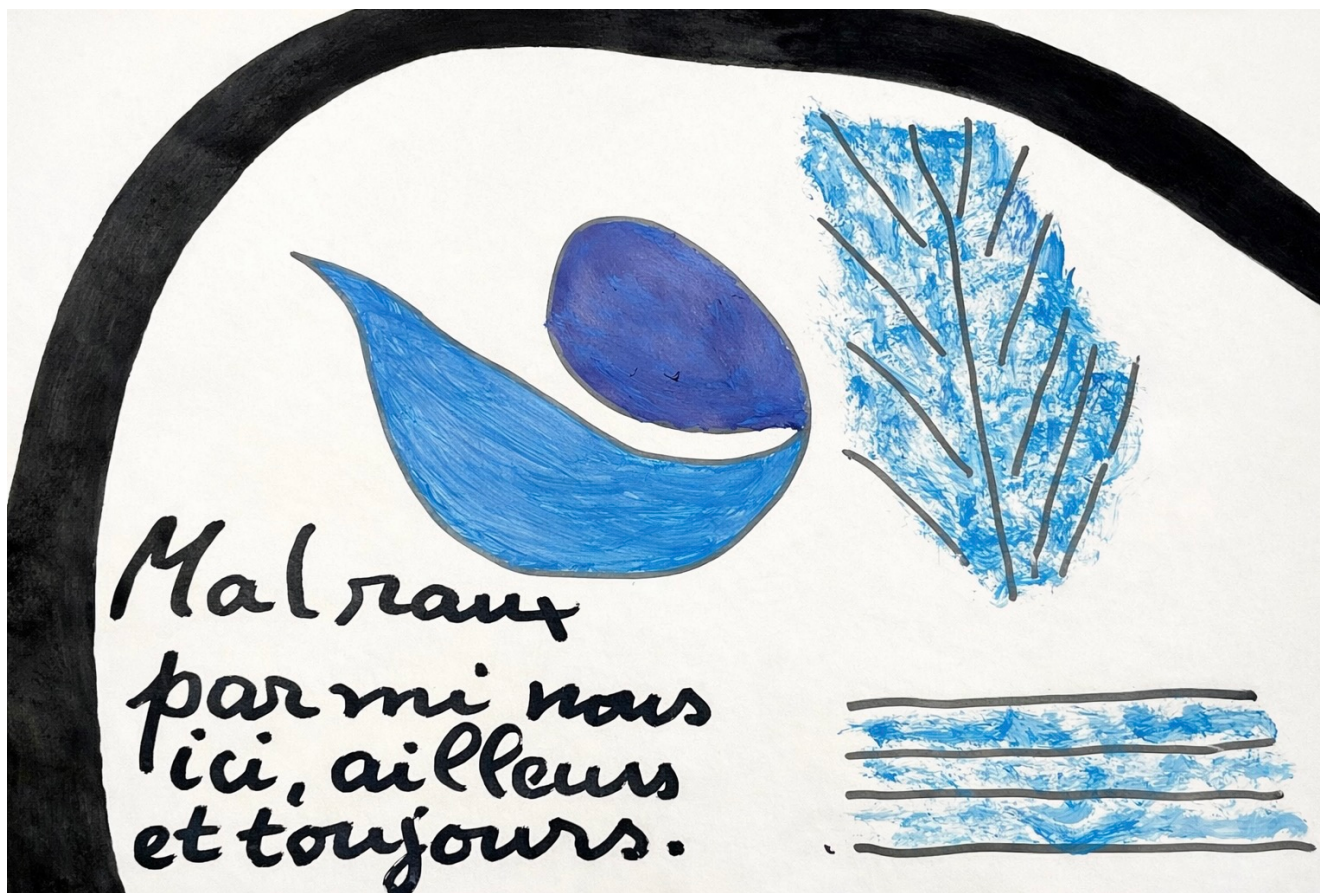
Dessin original de Dany Laferrière, de l'Académie française.

Ainsi se dessinera, tout au long de cette journée, un dialogue exigeant et nécessaire avec l'une des grandes consciences du XX e siècle – une invitation à penser, à partir de Malraux, ce que peut encore signifier aujourd'hui les combats pour la liberté des peuples et pour la liberté de l'esprit, lui qui avait dit aux étudiants du Bangladesh, voici 52 ans : « Vous avez montré au monde qu'on n'assassine jamais assez pour tuer l'âme d'un peuple qui ne se soumet pas. »