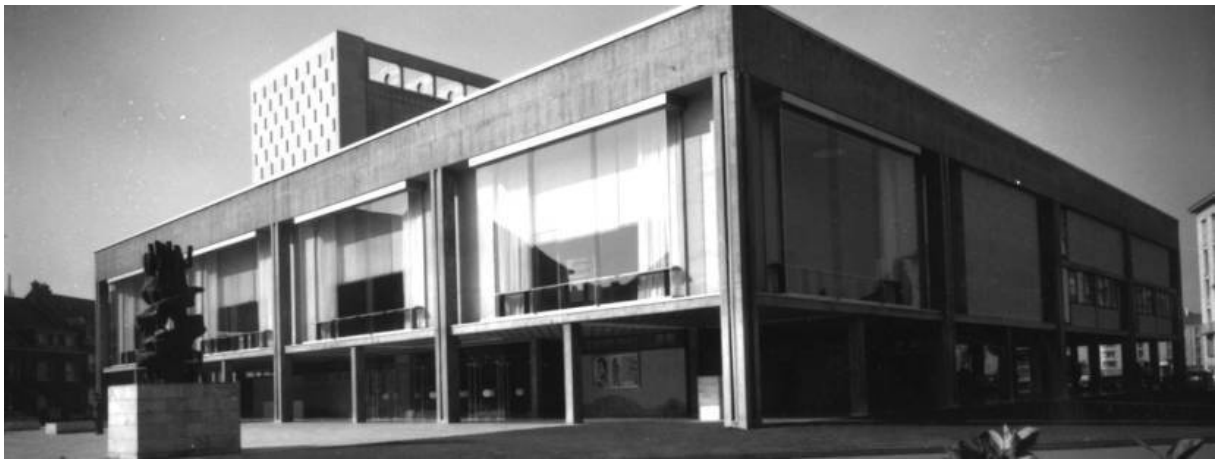
Maison de la Culture d'Amiens, 1966.

Ces choix reflètent l'esprit des maisons de la culture : confronter les publics à la création contemporaine autant qu'aux grandes œuvres du patrimoine.