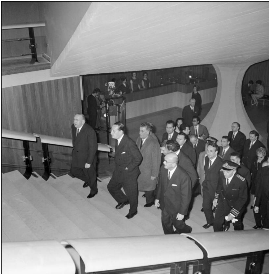
André Malraux, ministre d'Etat chargé des Affaires Culturelles, inaugure la sixième Maison de la Culture de France à Amiens, le 19 mars 1966.