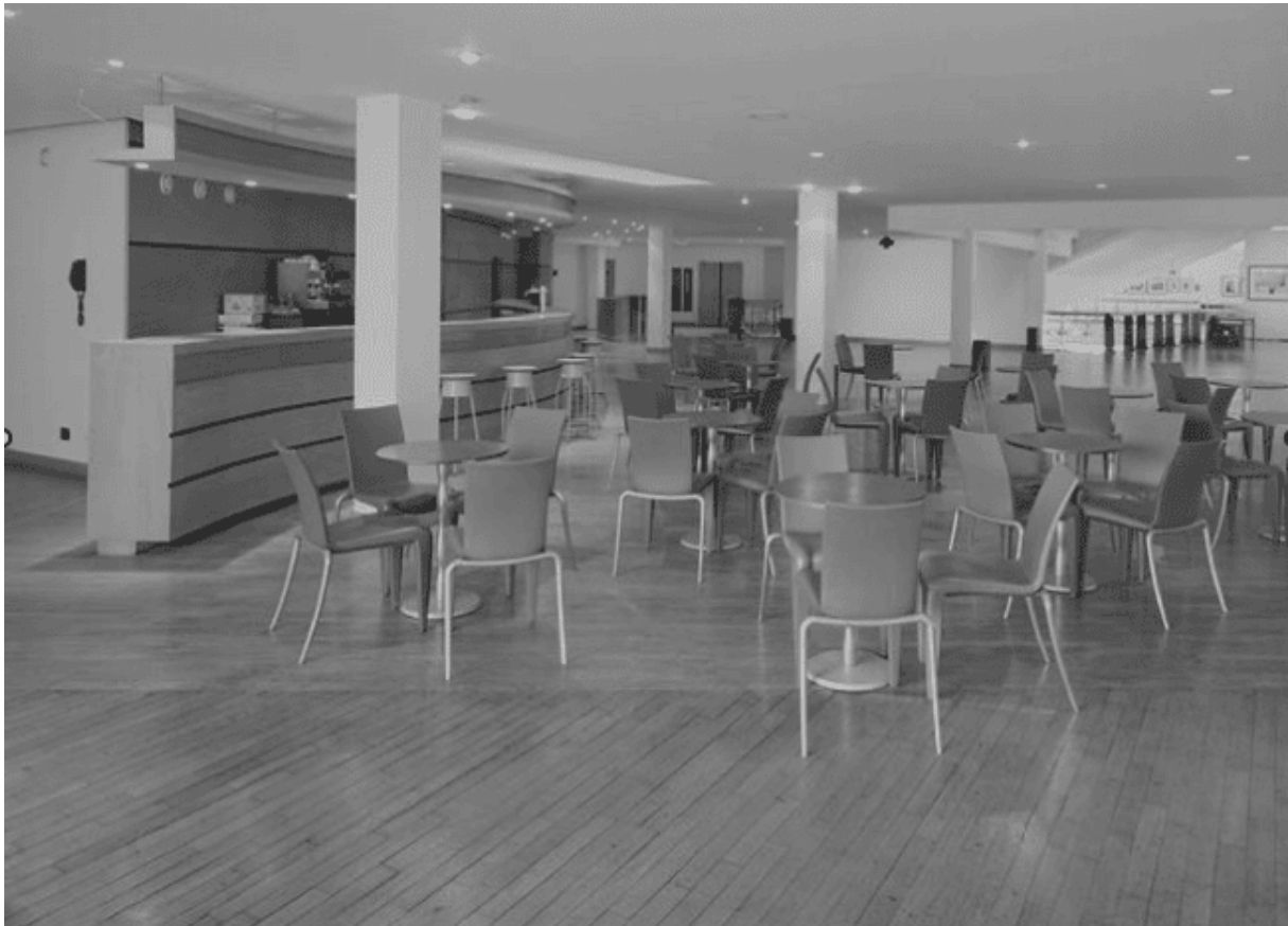
Maison de la Culture d'Amiens : vue de la cafétéria

La direction de Lhôte s'inscrit dans l'élargissement de la politique culturelle française des années 1980, intégrant la valorisation des industries artistiques et créatives . L'institution dépasse alors la seule diffusion pour participer à la production et à la circulation des œuvres et développe une stratégie originale associant spectacle vivant et industries culturelles. Deux structures éditoriales sont créées : la maison d'édition Trois Cailloux pour le livre, et en 1986 le label discographique Label Bleu , consacré au jazz et aux musiques improvisées. Label Bleu deviendra l'un des labels européens majeurs du jazz contemporain, accueillant notamment des artistes tels que Henri Texier, Louis Sclavis, Julien Lourau ou Archie Shepp .