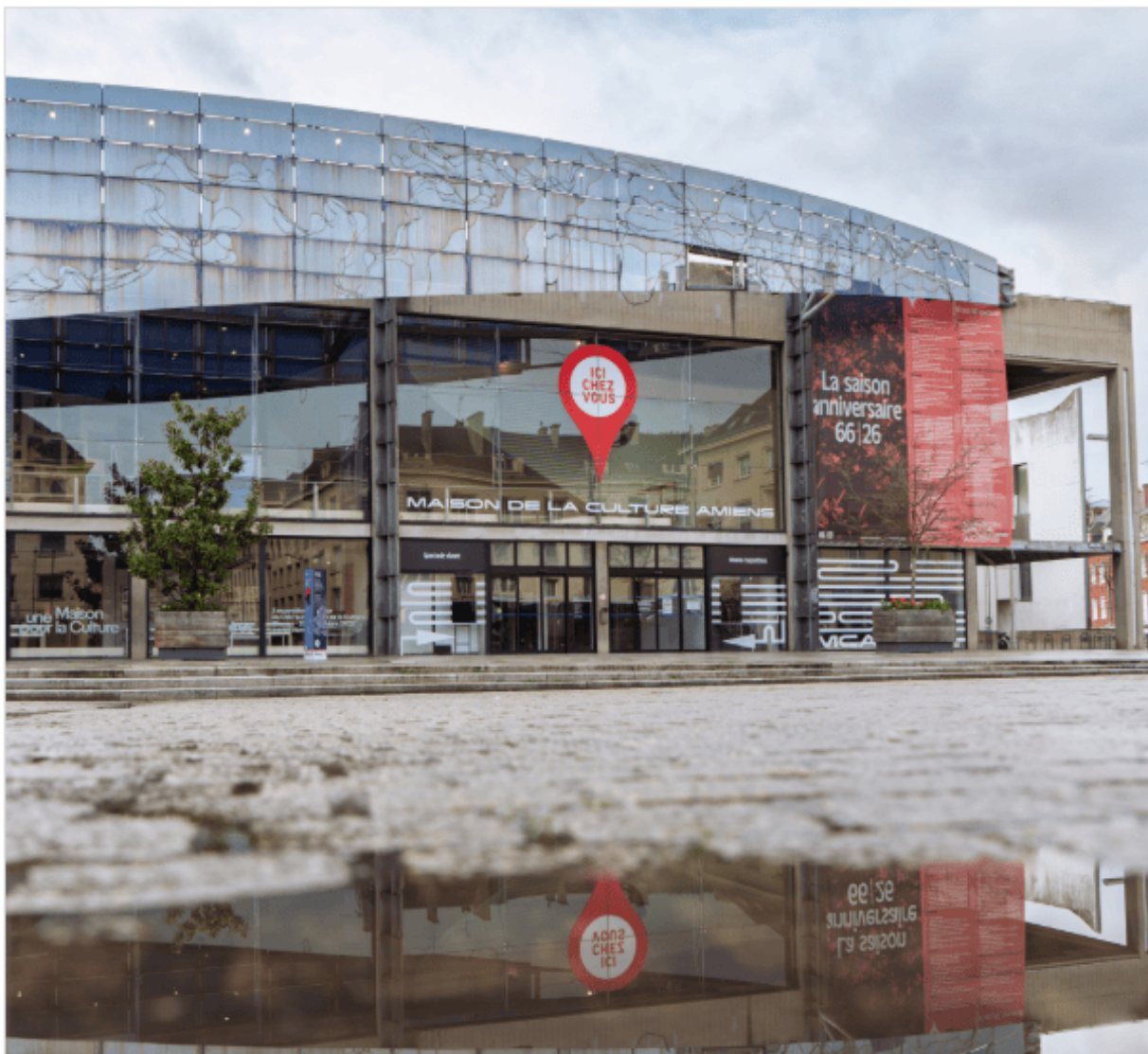
Vue de la façade de la Maison de la Culture d'Amiens, 2026

L'enjeu de la décennie est celui de l' ancrage territorial renforcé et de l'ouverture interdisciplinaire, inscrivant la MCA dans une logique de coopération avec d'autres structures culturelles (théâtres, scènes conventionnées, centres chorégraphiques).